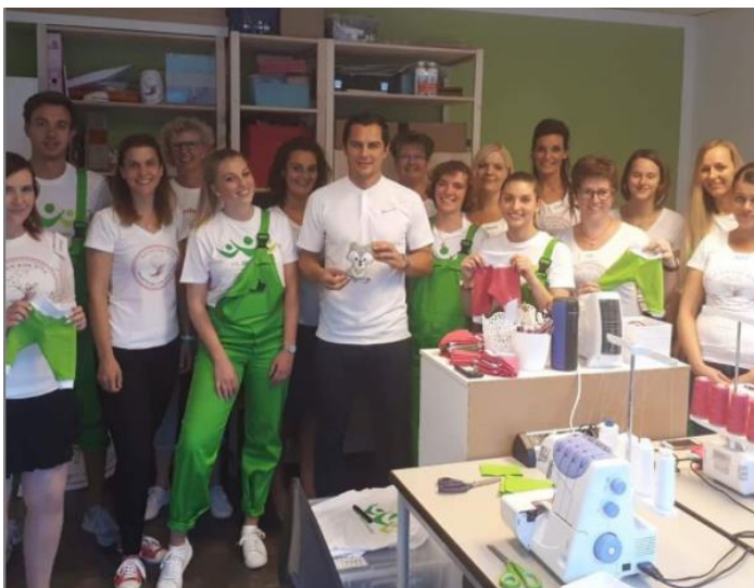
Gemeinsam Bewegen Tag 2018 11 für 11