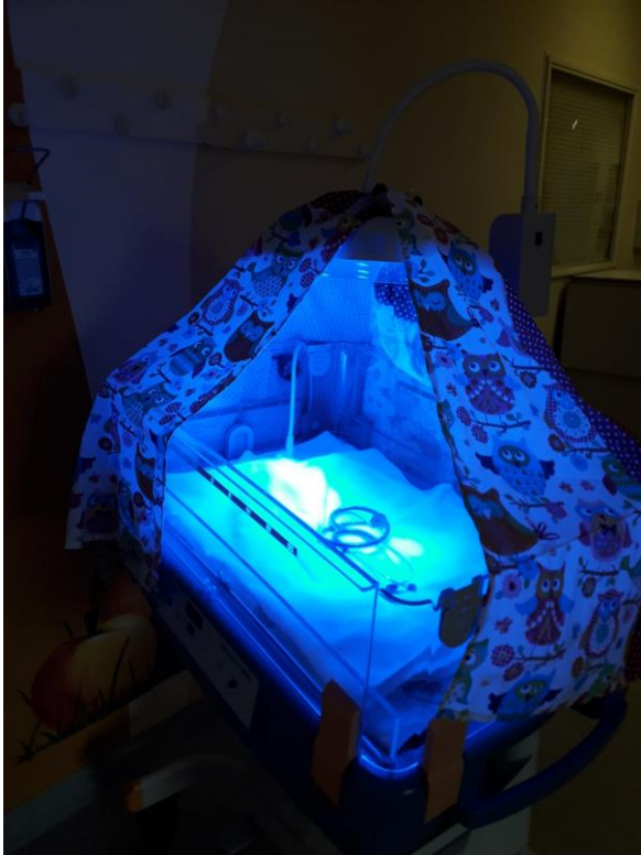
UV-Wärmebettchenabdeckung. Maßanfertigung für das Klinikum Wolfsburg.

Mützenlieferung ins Klinikum Helmstedt. 165 Mützen wurden für die Neugeborenen im Helios St. Marienberg Klinikum ausgeliefert.