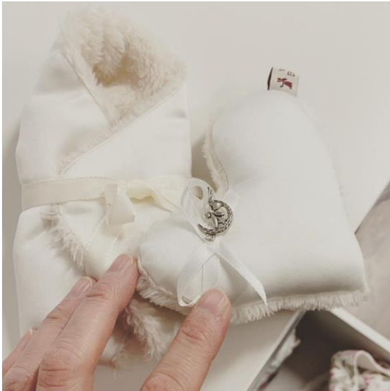
Sternendecke mit Erinnerungsherz in Größe 9 - 12 cm

Eine Lieferung für das Bestattungsinstitut Henning aus Bremen Achim mit Sternendecken und Kleider-Sets.